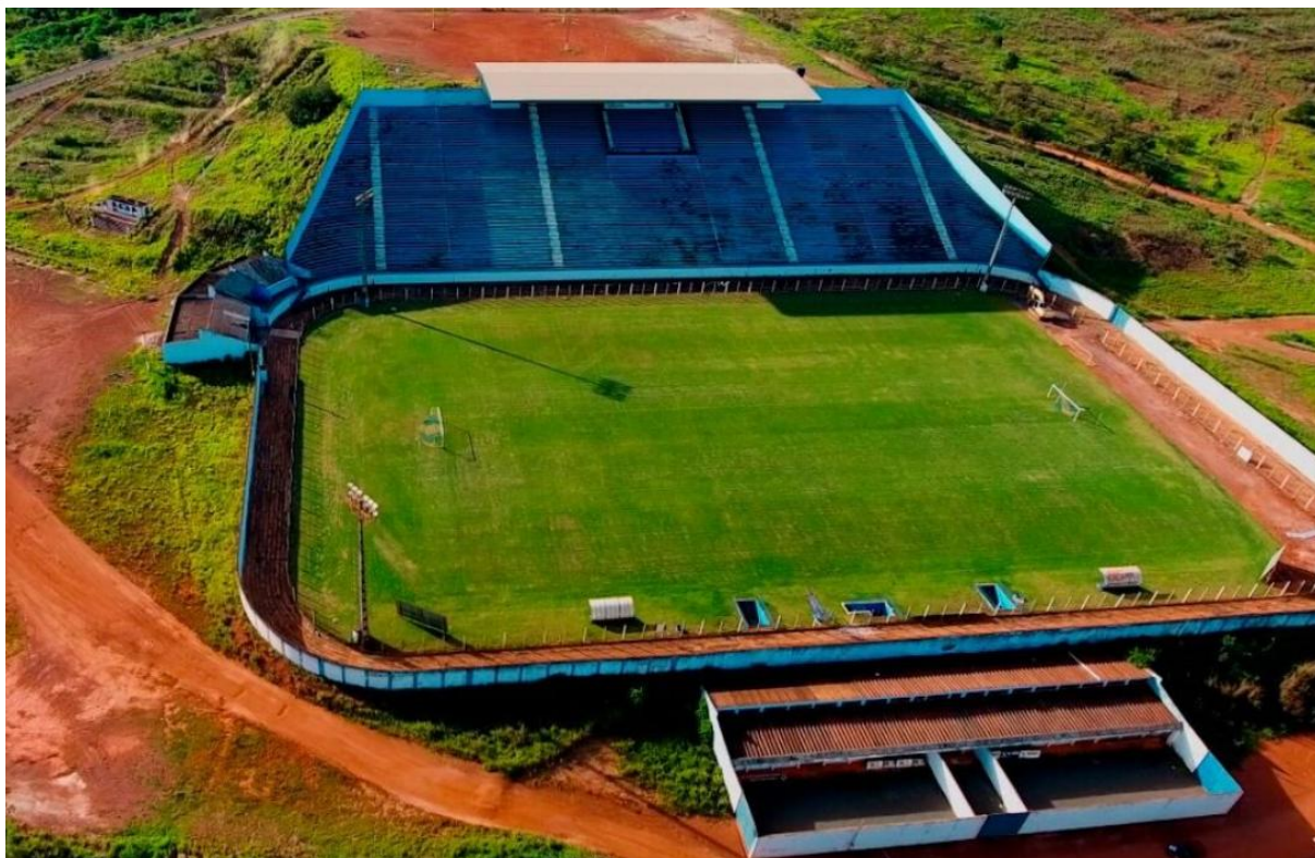
Imagem 10: Estádio Serra do Lago – Luziânia (GO)