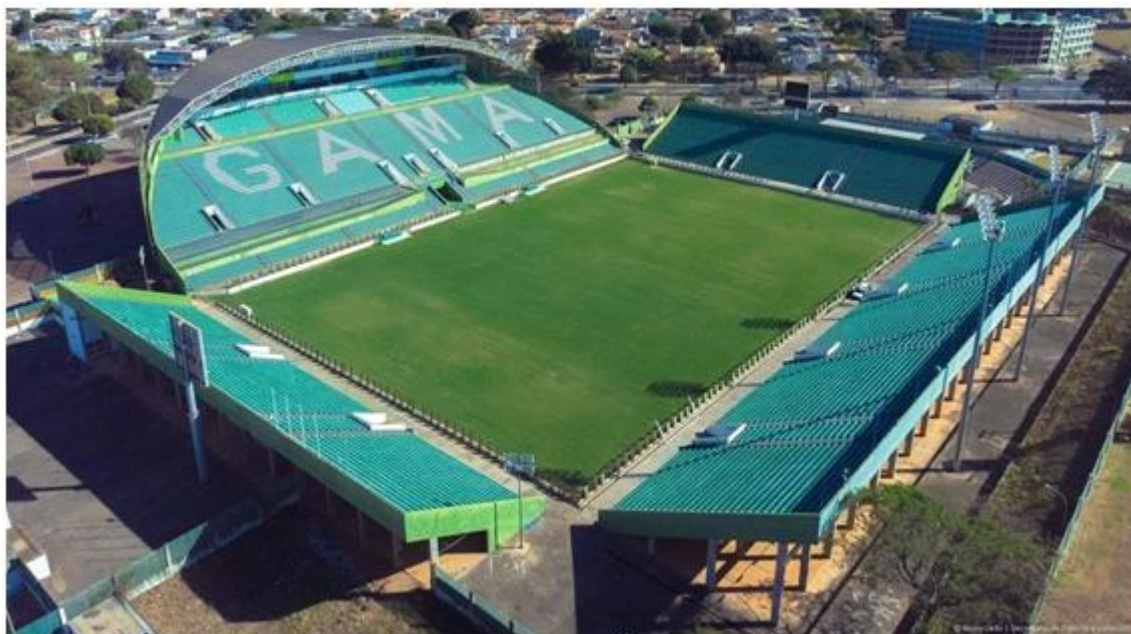
Imagem 4: Estádio Bezerrão (Gama)