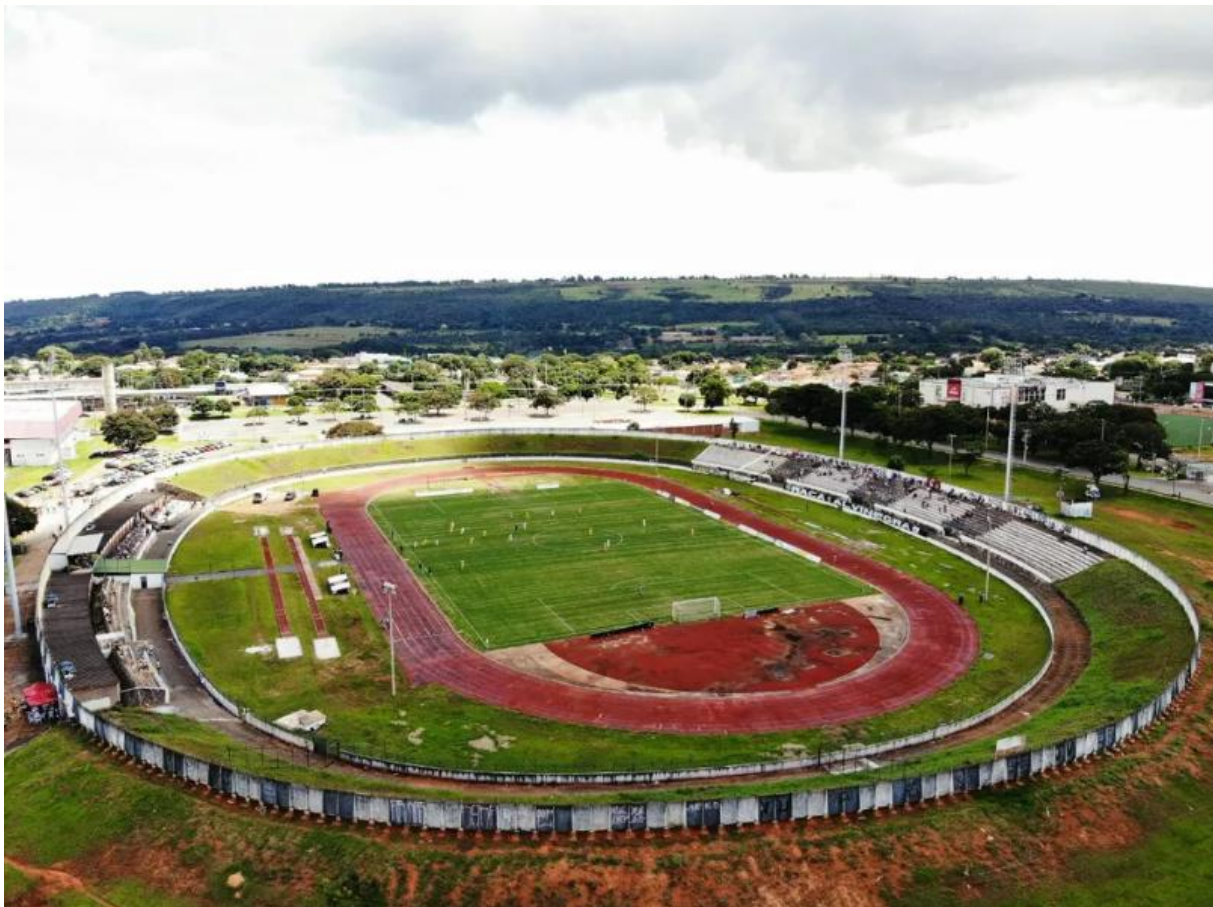
Imagem 11: Estádio Agostinho Lima – Sobradinho (DF)