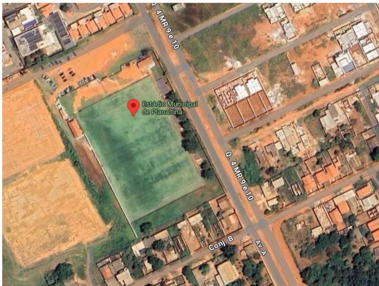
Imagem 12: Estádio Municipal de Planaltina (GO)