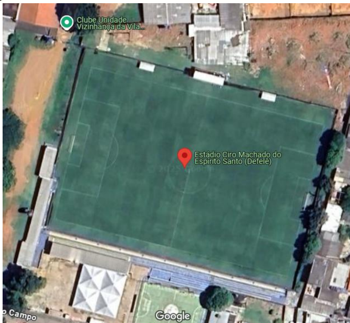
Imagem 9: Estádio Defelê (Vila Planalto)