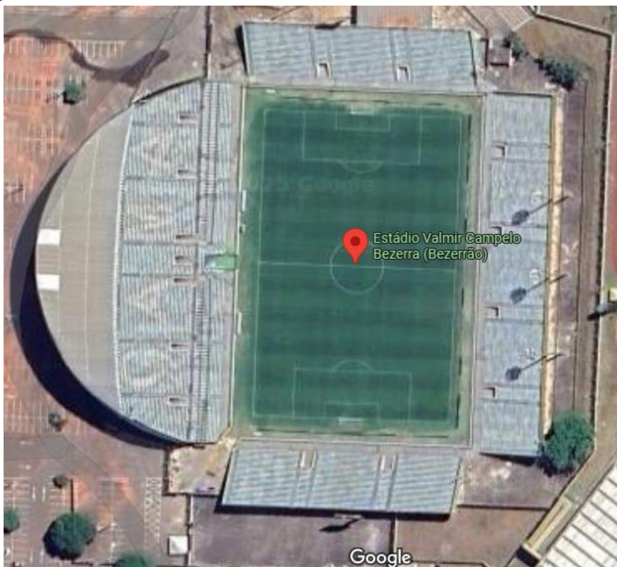
Imagem 3: Estádio Bezerrão (Gama)