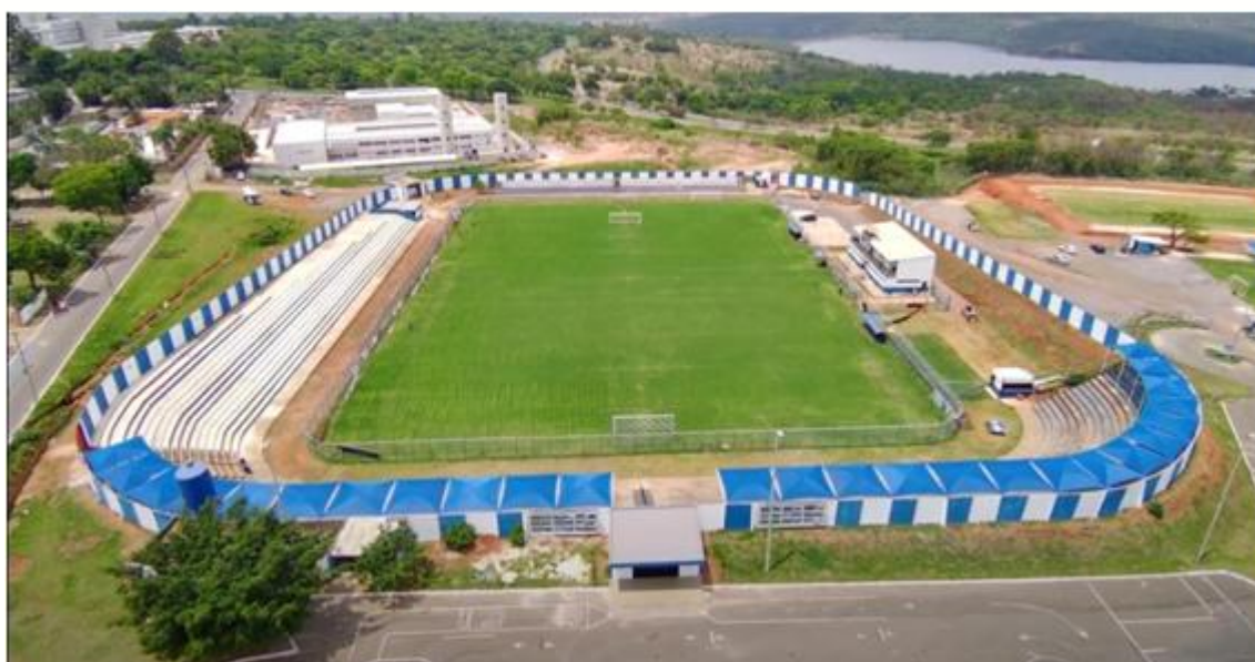
Imagem 5: Estádio JK (Paranoá)