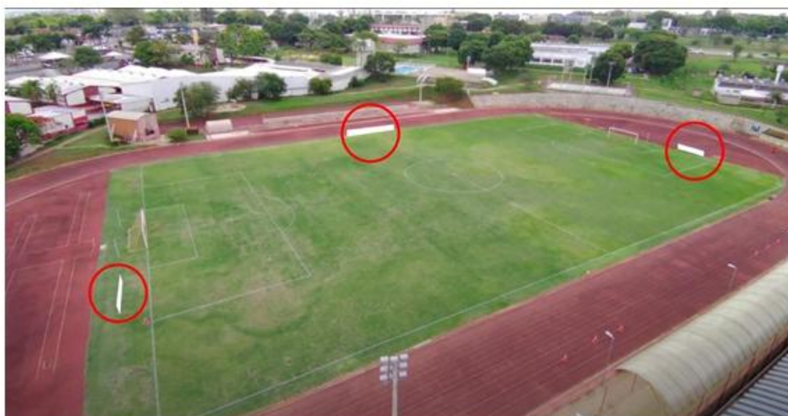
Imagem 1: Estádio do CECAF (Asa Sul). Os círculos em destaque vermelho representam onde as placas ficarão dispostas ao redor do campo.