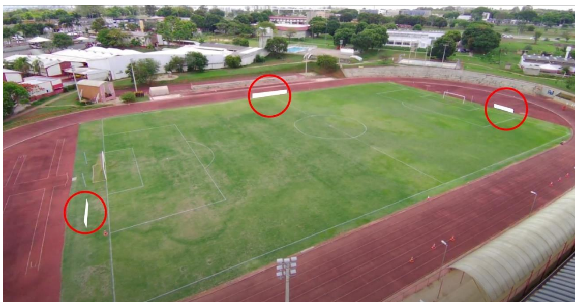
Imagem 1: Estádio do CECAF (Asa Sul). Os círculos em destaque vermelho representam onde as placas ficarão dispostas ao redor do campo.