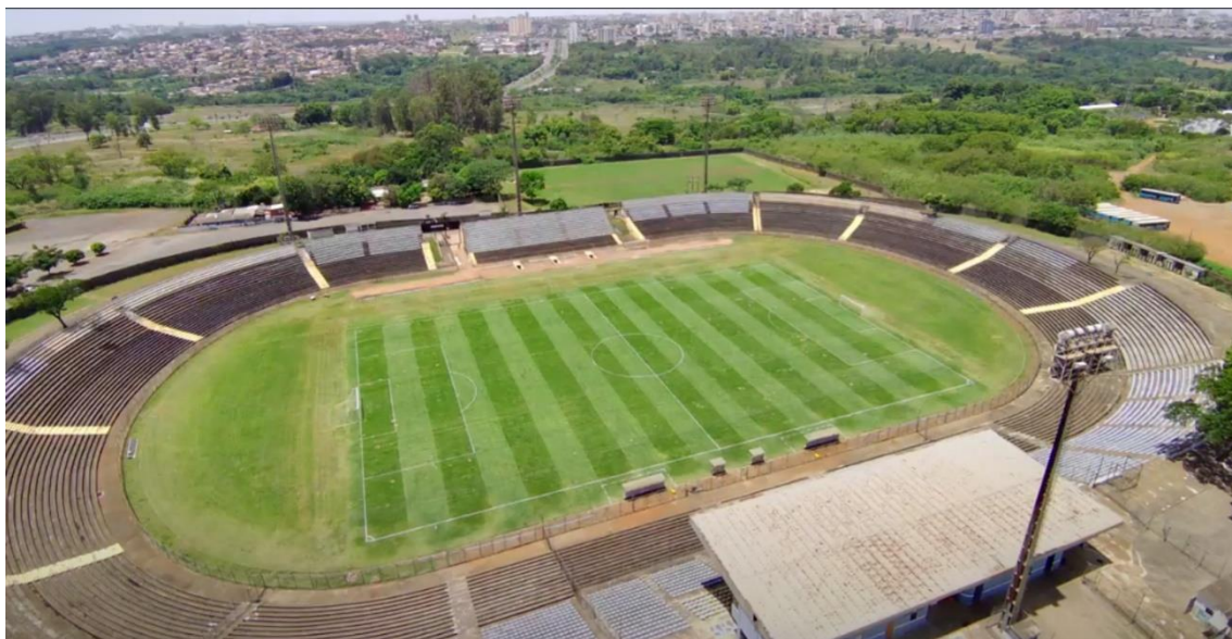
Imagem 2: Estádio Serejão (Taguatinga)